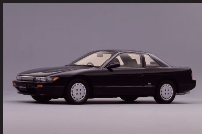
平成4年1月推出的Club Selection車型。該車型以K's和Q's車型為基礎，配有三連投射式頭燈、數位溫度顯示的自動空調等裝備。