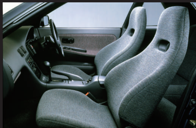
座椅採用一體成型的現代風格座椅。以「溫柔包覆乘坐者」為主題，採用了大量曲面的內裝設計。