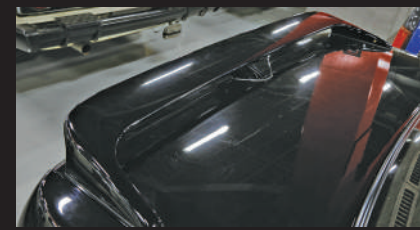
後擾流板被設置為選配裝備。照片顯示的是上市時的款式，而在平成4年的小改款後，它被改成了翼狀樣式。