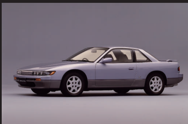
平成3年進行的小改款車型。更換了前格柵飾條、採用新造型輪圈等，其旨在提升車輛的質感及高級感。

第5代Silvia的引擎是繼承自上一代的1.8升直列四缸CA18型引擎，但在新車型上進行了DOHC化。有一款最大馬力為135ps的NA（自然進氣）型號CA18DE，以及一款最大馬力為175ps的渦輪增壓型號CA18DET。前者搭載在「J's」「Q's」等級，而後者則搭載在