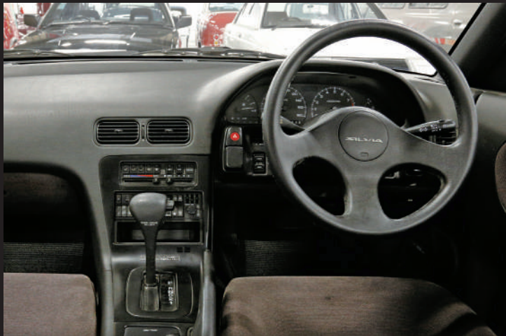
當時推出的Q's車款的儀錶板周圍。整體上採用了許多曲面設計，營造出優雅的氛圍。Q's和K's車款可選擇在前擋風玻璃上安裝能顯示速度的「前擋風玻璃顯示器」。