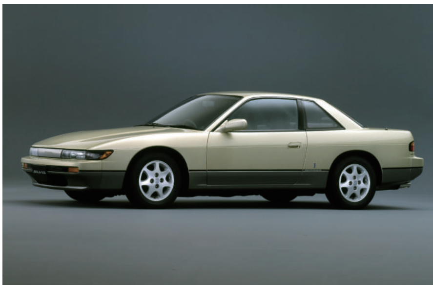
All Mighty車型於平成4年12月上市。該車型採用了歐式內裝設計，並配有多項實用裝備，例如電動收納式彩色車門後視鏡。隨著這款All Mighty車型的推出，「Q's SC」和J's等級車型也被停產了。

正如前文所述，第5代Silvia誕生的時代，正值第二代Prelude開創了「約會車」市場，這個市場具有很大的存在感。當時，售價約在200萬日元左右的雙門轎車受到年輕人的喜愛，對於製造商來說，這是一個不容忽視的市場。