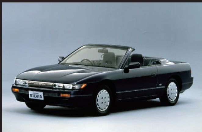
比原定晚了兩個月，於昭和63年7月上市的「敞篷車型」。它以K's車型為基礎開發，採用電動敞篷。車身各處都使用了加強材，以確保車身剛性。