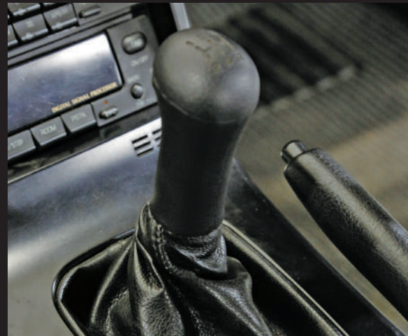
手排車的排檔桿。自排車採用了防止誤操作的排檔鎖系統，如需取下鑰匙，必須處於P檔。