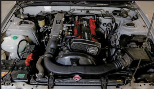
Q's的引擎室。搭載的CA18DE型引擎在平成3年的小改款中被換成SR20DET型和SR20DE型。實現了更銳利、更有扭力的駕駛體驗。